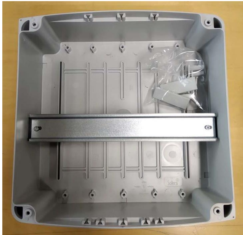
No se observa penetración de agua en el interior de la envolvente No water penetration was observed inside the enclosure