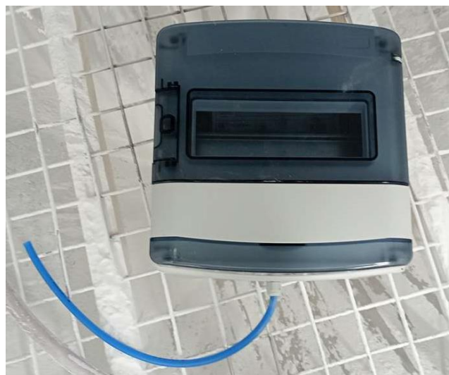
Muestra antes del ensayo (enviada preparada por el solicitante) Specimen before the test (submitted prepared by the applicant)