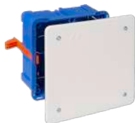
5362GW y 5562GW

107x107x45. 12xØ25. Tapa con tornillos. Ref.5562GW tapa con garra metálica.