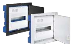
MP14HG y MP14NGHGW