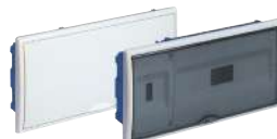
8881HG y 8881PFHGW