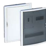
5420HG y 5420PFHGW