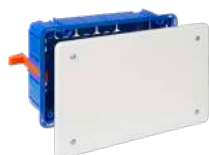
5363GW y 5563GW

107x107x45. 12xØ25. Tapa con tornillos. Ref.5562GW tapa con garra metálica.