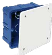
5362 y 5562

107x107x45. 12xØ25. Tapa con tornillos. Ref.5562 tapa con garra metálica.