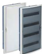
5270HG y 5270PFHGW