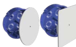
5515GW y 5516GW

Ø100x46. 10xØ25. Tapa con tornillo central.