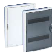
5250HG y 5250PFHGW