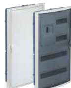
5440HG y 5440PFHGW