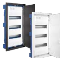
MP42HG y MP42NGHGW