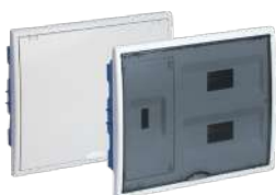
8203HG y 8203PFHGW