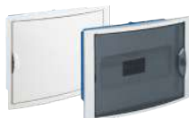
5012HG y 5012PFHGW