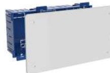
5530GW y 5530GWD

107x107x45. 12xØ25. Tapa con tornillos. Ref.5562 tapa con garra metálica.