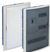
5430HG y 5430PFHGW