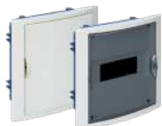
5108HG y 5108PFHGW