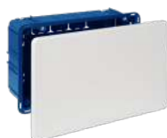
5363 y 5563

170x112x47. 16xØ25. Tapa con tornillos. Ref.5563 tapa con garra metálica.