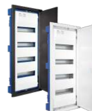
MP56HG y MP56NGHGW