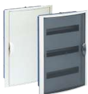
5260HG y 5260PFHGW