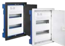
MP28HG y MP28NGHGW