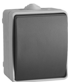
Ref. 3303.- Conmutador Ref. 3320.- Pulsador