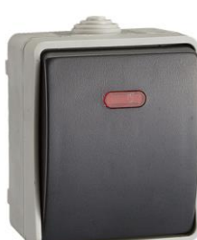
Ref. 3320IL.- Pulsador luminoso