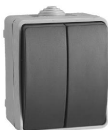
Ref. 3313.- Doble Conmutador